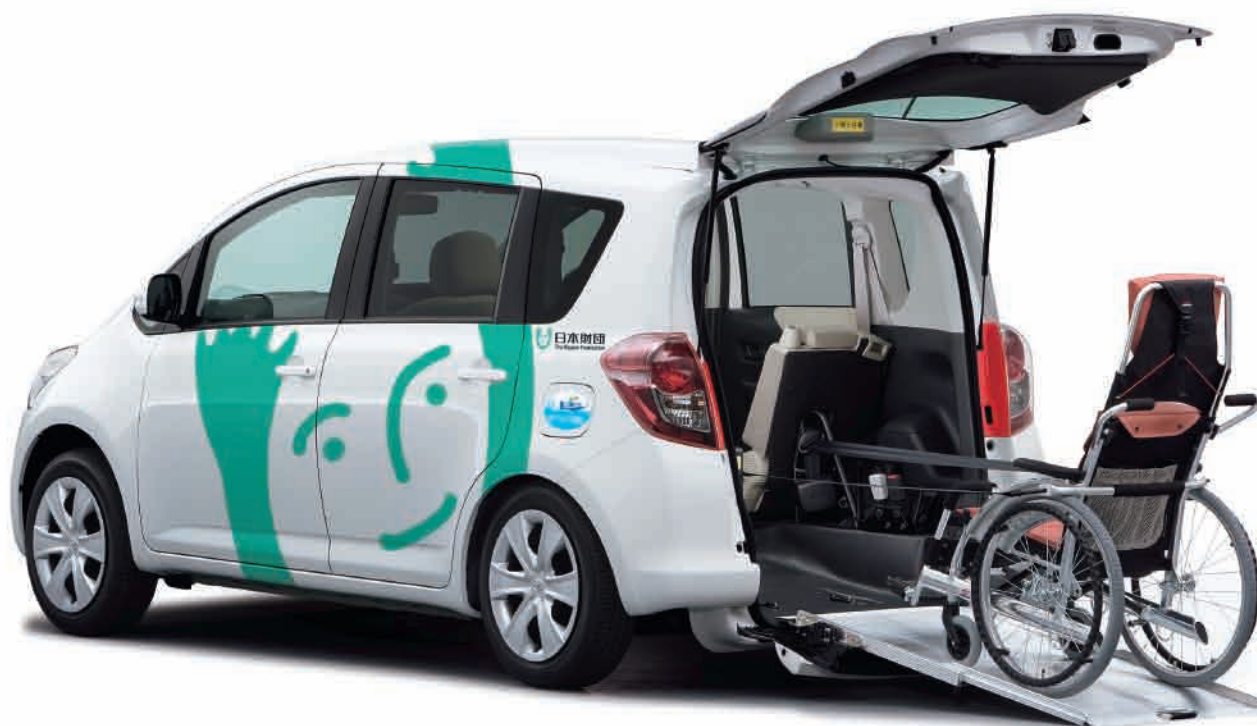
※写真の車いすは装備に含まれておりません。

このカタログは2009年5月現在のものです、仕様並びに装備は改良のため予告なく変更することがあります。