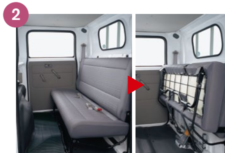
後席跳ね上げ式ベンチシート