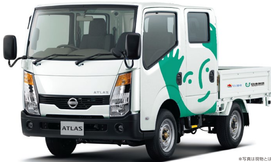
※写真は現物とは異なります。