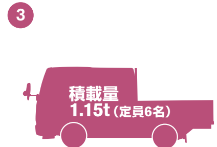
人も荷物もいっぱいのがせられます