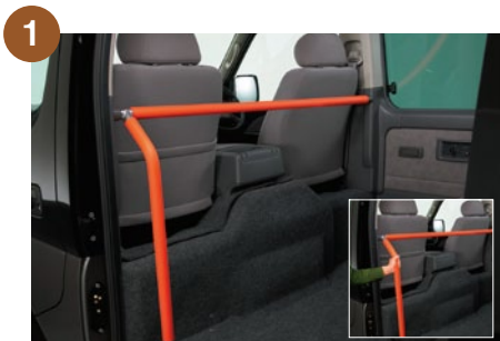
乗降用大型手すり (グリップパイプ一体)