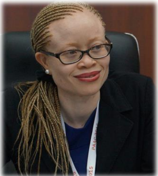
イクポンウォサ (I.K.)イロ 国連独立専門家

立教大学大学院社会学研究科にて社会学博士号取得後、2016年より現職。日本アルビニズムネットワークのスタッフとして、当事者支援、啓発などの活動も行う。その専門性を活かし、自身の経験にのみよるのではなく、社会学の観点からアルビニズムについて考察した著書『私がアルビノについて調べ考えて書いた本ー当事者から始める社会学』（生活書院）を2017年に出版。各種メディアにおける取材にも多数応じ、独自の見解を示している。2018年9月、日本社会学会第17回奨励賞受賞。