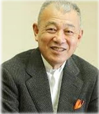
笹川 陽平 日本財団会長

アジア最大規模の財団、日本財団のトップとしてアジア、アフリカ、南米などを訪れ、国際的な課題解決に力を入れている。本会議の発案者。徹底した現場主義にもとづく草の根の取り組みを続ける一方、各界の世界的リーダーとのネットワークを駆使し、具体的な成果にこだわる活動を信条としており、国内外でインクルーシブな社会の実現に向け、精力的に活動している。特に、人類の歴史上最も古くから知られ、恐れられてきた病気のひとつ、ハンセン病の制圧にむけて40年以上にわたり世界各地の療養所を訪問するなど現場での活動を続ける一方、病気の制圧だけでなく、長年厳しい差別に直面してきた患者や回復者の人権回復を国際社会に働きかけ、国連総会で「ハンセン病差別撤廃決議」の採択を実現させた。