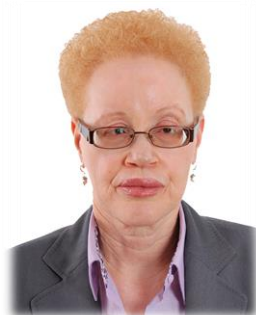
ムンビ・ングリ ケニア高等裁判所 判事

南アフリカ教育省に30年以上勤めた教育者であり、アフリカにおけるアルビニズムの啓発をライフワークとする。南アフリカ・アルビニズム・ソサエティ（ASSA）、汎アフリカ・アルビニズム連合（PAAA）を創設。国連への働きかけも行い、6月13日の国際アルビニズム・デー制定に寄与した。また、障害者の権利に関する活動が評価され、南アフリカの障害者政策における大統領直轄の委員会のメンバーとしても活躍している。