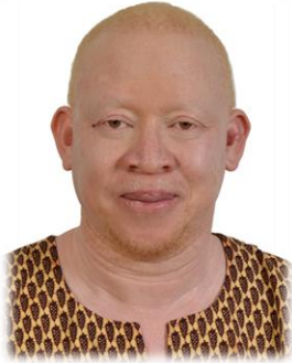
イサック・ムワウラ