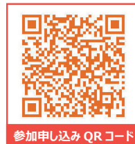
参加申し込み QR コード

ブース出展(予定)：アクロスジャパン、あんしん母と子の産婦人科連絡協議会、家庭養護促進協会、 日本国際社会事業団、フローレンス、ベアホープ、Baby ぽけっと、ベビーライフ、環の会 等 (五十音順)