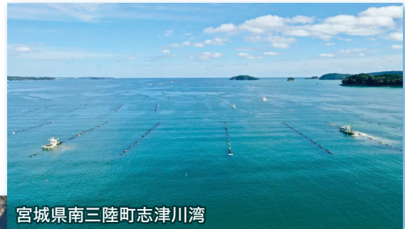
宮城県南三陸町志津川湾