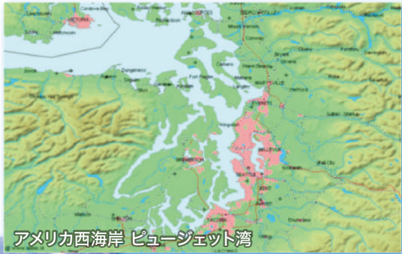
アメリカ西海岸 ピュージェット湾