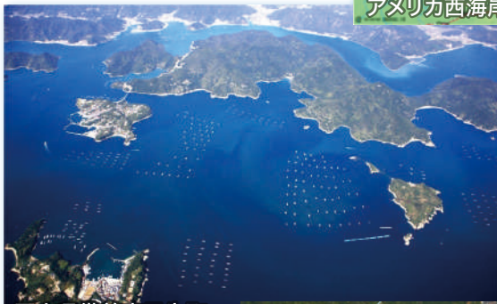
岡山県備前市日生町