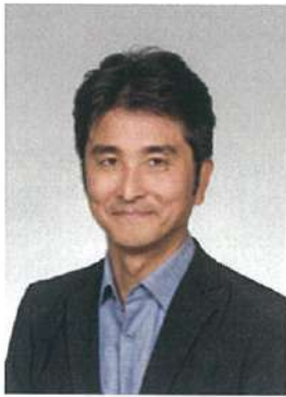
太田義孝 (おた よしたか)

ワシントン大学 教授。専門は海洋人類学、海洋管理に関わる公共政策。世界各地の海で魚資源の管理と漁業文化についての学際的研究に従事。自然科学と社会科学をつなぐ政策ディレクターとして政策と社会をつなぐ。海の未来を総合的に予測する日本財団ネレウスプログラム（2011～2019）の統括リーダーであり、同プログラムの成果“Predicting Future Ocean”の主な部分を翻訳、編集して2021年8月に「海洋の未来」を出版。2019年にはワシントン大学を中心に世界の20の大学が連携して取り組む日本財団ネクサスプログラムを発足させ、「人と海」を守るため全力で奮闘中。