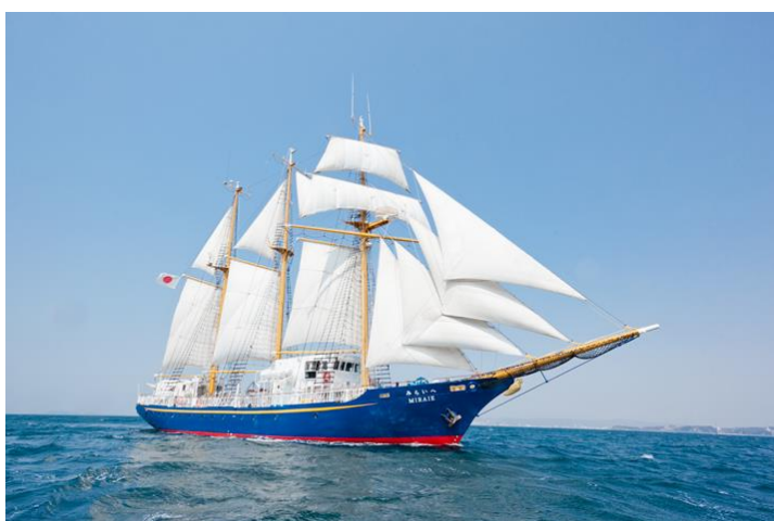
帆船「みらいへ」(一社 グローバル人材育成推進機構所有)

「みらいへ」は、従来のセイルトレーニングに社会心理学や経験学習理論など冒険教育の手法を取り入れた独自の効果的なプログラムを提供し、次代を担う人材育成をしています。この日帰りツアーでは、船上で帆を揚げる展帆、しまう畳帆、ロープワーク、操舵等の体験やデッキ上のゲームなど多彩なアクティビティを行います。