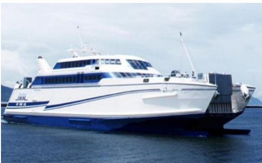
オーシャンアロー (熊本フェリーKK 所有)