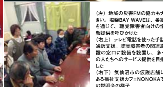
(左) 地域の災害FMの協力も大きい。塩釜BAY WAVEは、番組を通じて、聴覚障害者向けの情報提供を呼びかけた (右上) テレビ電話を使った手話通訳支援。聴覚障害者の関連施設の窓口に設備を設置し、多くの人たちへのサービス提供を目指した (右下) 気仙沼市の仮設店舗にある福祉支援カフェNONOKAでの説明会の様子