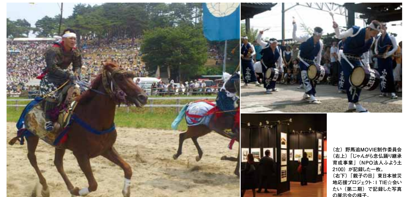
(左) 野馬追MOVIE制作委員会 (右上) 「じゃんがら念仏踊り継承育成事業」(NPO法人ふよう土2100)が記録した一枚。 (右下) 「親子の日」東日本被災地支援プロジェクト:TIE☆会(第二期)で記録した写真の展示会の様子。

また、気仙沼写真復興プロジェクトが行う「気仙沼大島写真教室」では、子供達を対象に写真教室を開いた。子供たちは簡単なレクチャーを受けた後、グループになり、テーマを決めて撮りにいく。学校とはまた違った学びの中で、楽しそうな子供たち。その姿を見て、今度は大人が元気をもらおうという。写真や映像は単なる記録ではなく、撮った人、写っている一人ひとりにとって特別な意味を持つ。第2期の本プロジェクトは、写真を媒介に地域や個人に新しい価値を生み出している。