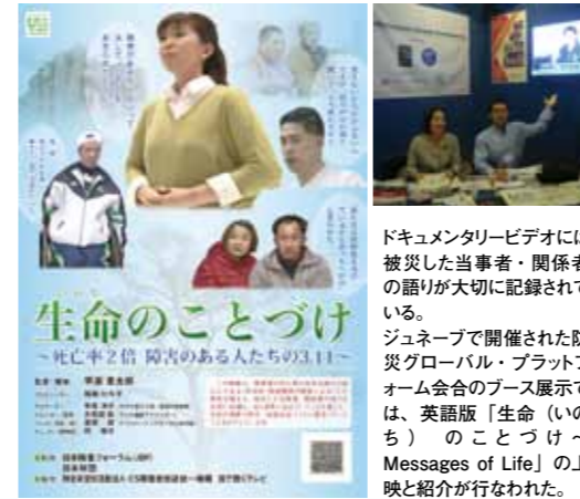
ドキュメンタリービデオには被災した当事者・関係者の語りが大切に記録されている。ジュネーブで開催された防災グローバル・プラットフォーム会合のブース展示では、英語版「生命 (いのち) のことづけ～Messages of Life」の上映と紹介が行われた。

日本財団と日本障害フォーラム (JDF) は、被災障害者の実態や支援活動、必要とされる施策についてまとめたドキュメンタリービデオ「生命 (いのち) のことづけ」を作成した。この作品は東京で一週間の上映期間に444名の来場者を集めた他、三カ国語に翻訳され、国連アジア太平洋経済社会委員会 (ESCAP) や国連国際防災戦略事務局 (UNISDR) による国際会議などで上映・報告された。これらの成果は今後もJDFの国内外での障害者施策推進活動に役立てられていく。