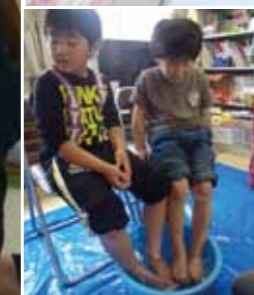
(左上) 足湯は、誰にでも関わりやすい支援の場でもある。ひとりの人とのつながりから、被災者・支援者双方に、新たな力が育まれていく。 (右上) 集められた「つぶやき」をもとに、量的・質的分析が行われた。 (右下) 子どもからお年寄りまで参加者は多数。全体として女性の利用が多く見られた。