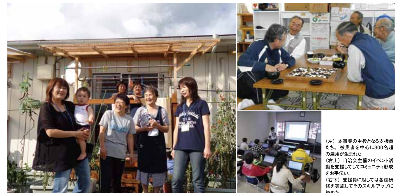
(左) 本事業の主役となる支援員たち。被災者を中心に300名超の雇用が生まれた。 (右上) 自治会主催のイベント活動を支援してコミュニティ形成をお手伝い。 (右下) 支援員に対しては各種研修を実施してそのスキルアップに努めた。

先行して大船渡市で開始した本事業は、被災地における先進事例として注目を集め、2012年2月には大槌町、同年3月には釜石市へ横展開された。展開にあたり必要となった仕組みの「モデル化」においては、ジョンソン・エンド・ジョンソン社会貢献委員会の寄付金を活用。仮設住宅を個別訪問してのアセスメント調査から、支援員のスキルアップへ向けた研修の実施、自治会活動活性化のための企画推進などが行われた。こうしたノウハウはマニュアル化されるとともに3地域で共有され、更に他県自治体への展開調整が進んでいる。