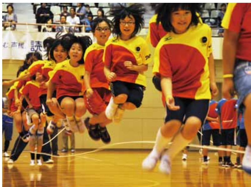
(上)「オリンピックデー・フェスタinいわき」での大縄跳びの場面。 (右上) ロンドンオリンピック派遣を経験したジュニアアスリート。 (右下) 陸前高田で開催したスポーツ教室参加者の集合写真。

ラッフル(慈善福引)により寄付を集め、スポーツを通して被災地を元気づける。具体的には、イベント開催、スポーツ用具の寄贈、被災地ジュニアアスリートのロンドンオリンピック派遣などに使われた。