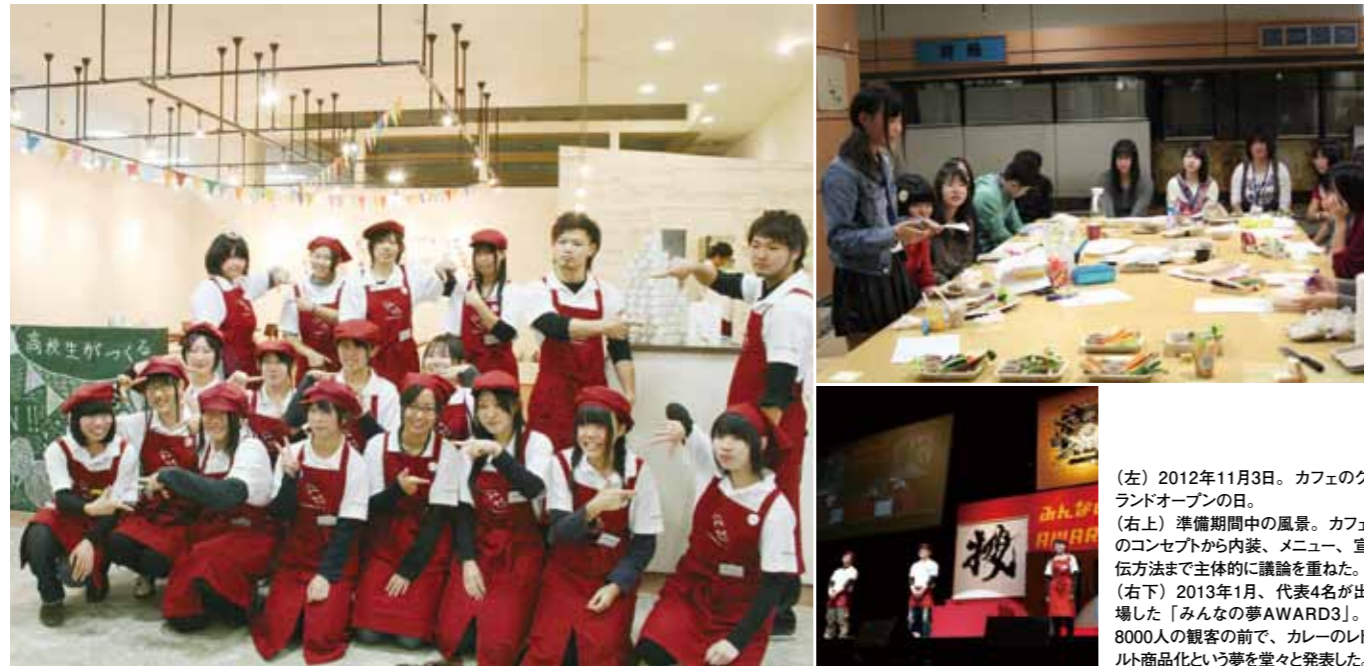
(左) 2012年11月3日。カフェのグランドオープンの日。 (右上) 準備期間中の風景。カフェのコンセプトから内装、メニュー、宣伝方法まで主体的に議論を重ねた。 (右下) 2013年1月、代表4名が出場した「みんなの夢AWARD3」。8000人の観客の前で、カレーのレトルト商品化という夢を堂々と発表した。

震災後、比較的支援が少なかった高校生をターゲットに、主体的なカフェづくりと運営をサポート。地域・世代を越えて、さまざまな人とのつながりを築きながら、社会を学ぶ機会に。