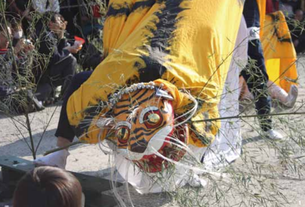
1.釜石虎舞保存連合会 虎舞の様子 2.仰山流笹崎鹿踊 3.安太々良太鼓保存会 4.2011年の小槌神社祭典 5.磯草虎舞保存会 虎舞の様子 6.2012年の小槌神社祭典 7.8.鳥海塩神社植樹祭 植樹祭に参加する学生ボランティア

震災前には気づけなかった伝統芸能の支えを意識し、それがあったからこそ立ち直れたという人もいる。外に出てしまった人たちが、祭りのために戻ってきてコミュニティの結束力が高まったという話もある。そんな祭りを復興することは、自分たちだけでは無理だった、日本財団に感謝している、という人々の声を多く聞くことができた。