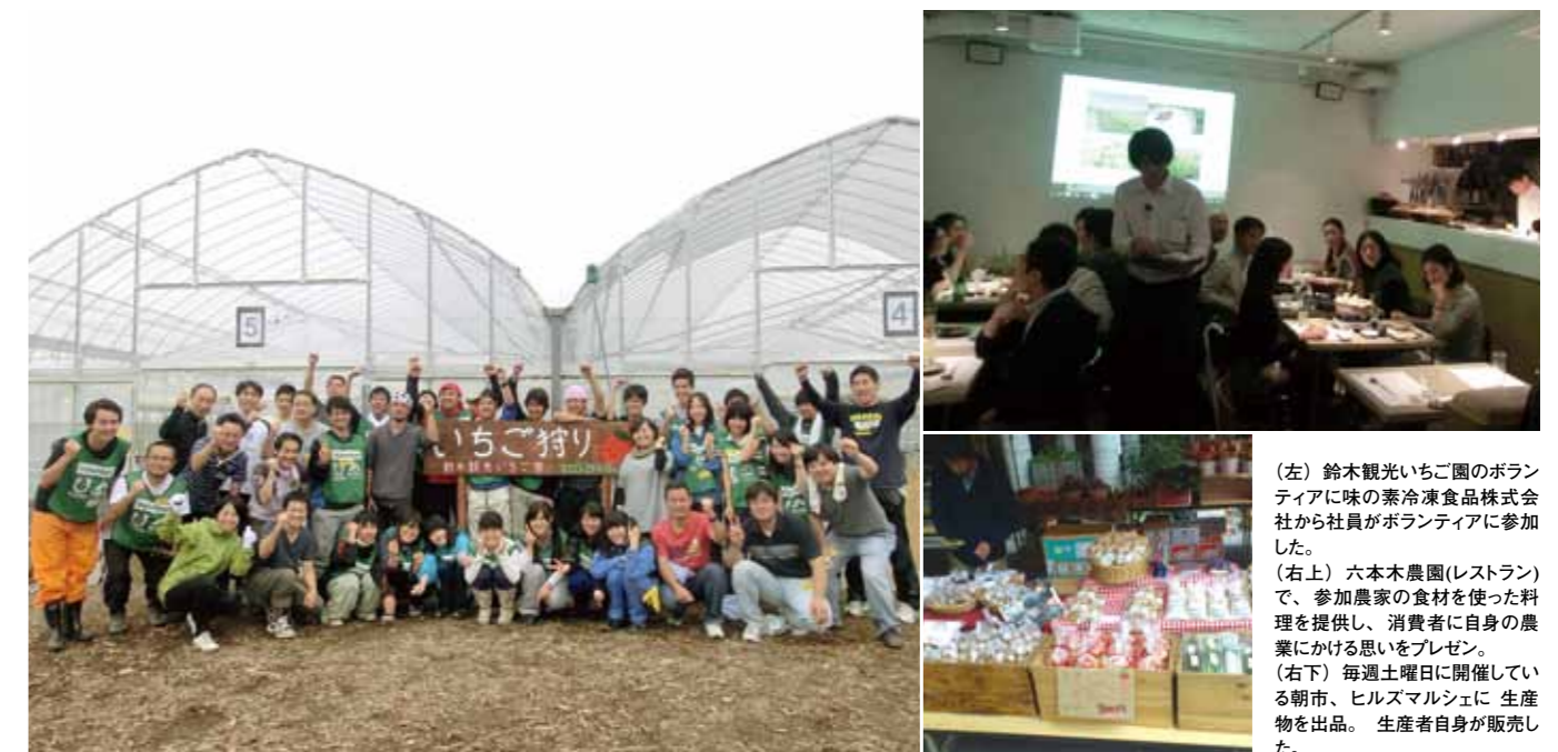
(左) 鈴木観光いちご園のボランティアに味の素冷凍食品株式会社から社員がボランティアに参加した。 (右上) 六本木農園(レストラン)で、参加農家の食材を使った料理を提供し、消費者に自身の農業にかける思いをプレゼン。 (右下) 毎週土曜日に開催している朝市、ヒルズマルシェに生産物を出品。生産者自身が販売した。

震災でダメージを受けた農家が、農業を再開するという観点では、一刻も早い設備復旧は大切だ。しかし、「一過性で終わらせない」長期的な視野に立った支援こそが農業には必要とされている。今回の一連の支援では、農家自身を「生産者から経営者に育てる」ことを重要視した。具体的には、良き生産者であることに加えて「販売・販促・組織作り・財務」の4要素を身につけるといふもの。今回の一連の「3R-Step」で、農家が経営者として震災前より売上を伸ばしていけることを強く意識し、支援を行った。