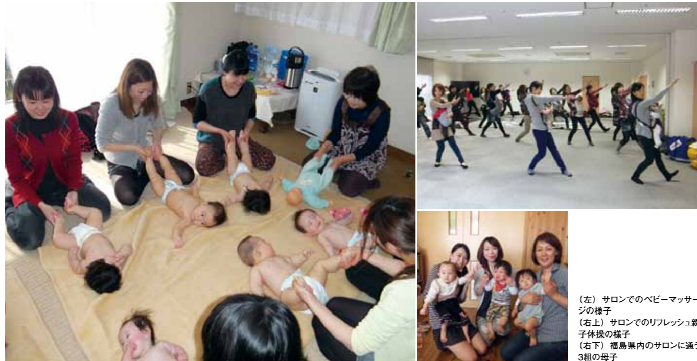
(左) サロンでのベビーマッサージの様子 (右上) サロンでのリフレッシュ親子体操の様子 (右下) 福島県内のサロンに通う3組の母子

震災で被災した母親の産後うつのは発生率は通常より3割高い。また、原発問題を抱える福島では、放射能汚染、避難に伴う生活環境の変化などの課題もある。本プロジェクトは、福島において安心できる子育て環境作りを目指す。