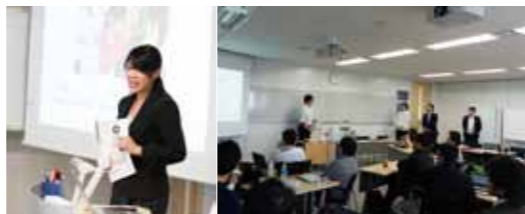
グロービス経営大学院の講義の一場面。奨学生がケースを発表している。