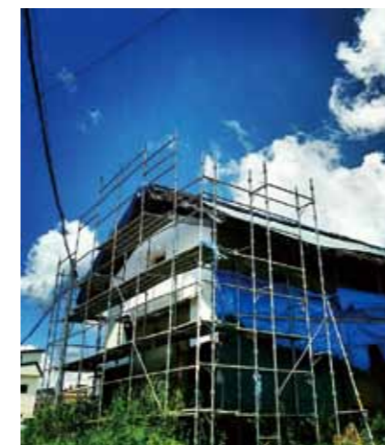
はじまりの美術館は、2014年5月にグランドオープン予定。地域に親しまれる拠点となることを目指し、オープンに向けて様々な企画を通じて地域と対話を進める。

支援先の第一号として（福）安積愛育園が福島県・猪苗代町の住民と協働して進めるアール・ブリュット美術館「はじまりの美術館」が選ばれ、契約が締結された。被災した歴史ある酒蔵をリノベーションしてつくられるこの美術館には、地域の人たちが自身の文化に誇りを持ち、心を通わせ合い、情報発信の拠点となることが期待されている。