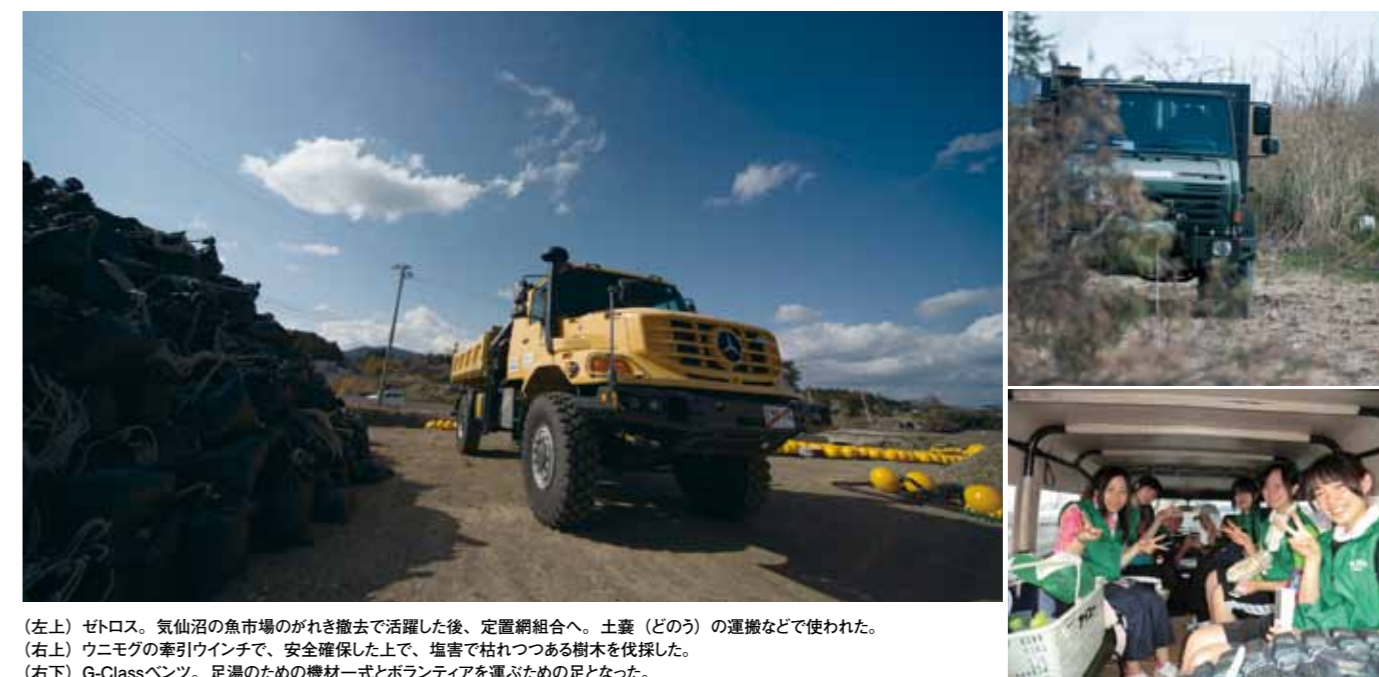
(左上) ゼトロス。気仙沼の魚市場のがれき撤去で活躍した後、定置網組合へ。土嚢(ど)の運搬などで使われた。 (右上) ウニモグの牽引ウインチで、安全確保した上で、塩害で枯れつつある樹木を伐採した。 (右下) G-Classベンツ。足湯のための機材一式とボランティアを運ぶための足となった。

2013年5月。ダイムラーの特殊車両は2年間の時限が来たため、その役割を終了した。活用していた団体から惜しまれつつも、その役目を終え、廃車された。一部は石川県の自動車博物館に寄贈された。また、三菱ふそうトラック・バスのキャンターは、引き続き活用されていく。