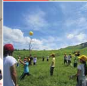
(左) 2012年度はのべ574名が活動した、チーム「ながぐつ」。各国からの留学生の参加も多かった。 (右上) 現地の宿泊所は、自主的な共同生活と、ミーティングや大学を越えた語らいの場となっている。 (右下) Gakuvoと協定関係を結ぶ日本文理大学は、仮設住宅に暮らす子どもたちを大分に引き、自然の中で遊べるキャンプを実施した。