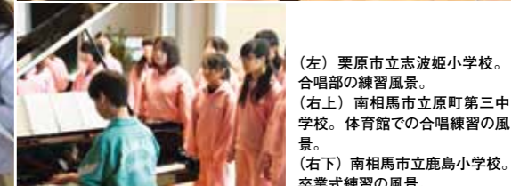
(左) 栗原市立志波姫小学校。合唱部の練習風景。 (右上) 南相馬市立原町第三中学校。体育館での合唱練習の風景。 (右下) 南相馬市立鹿島小学校。卒業式練習の風景。