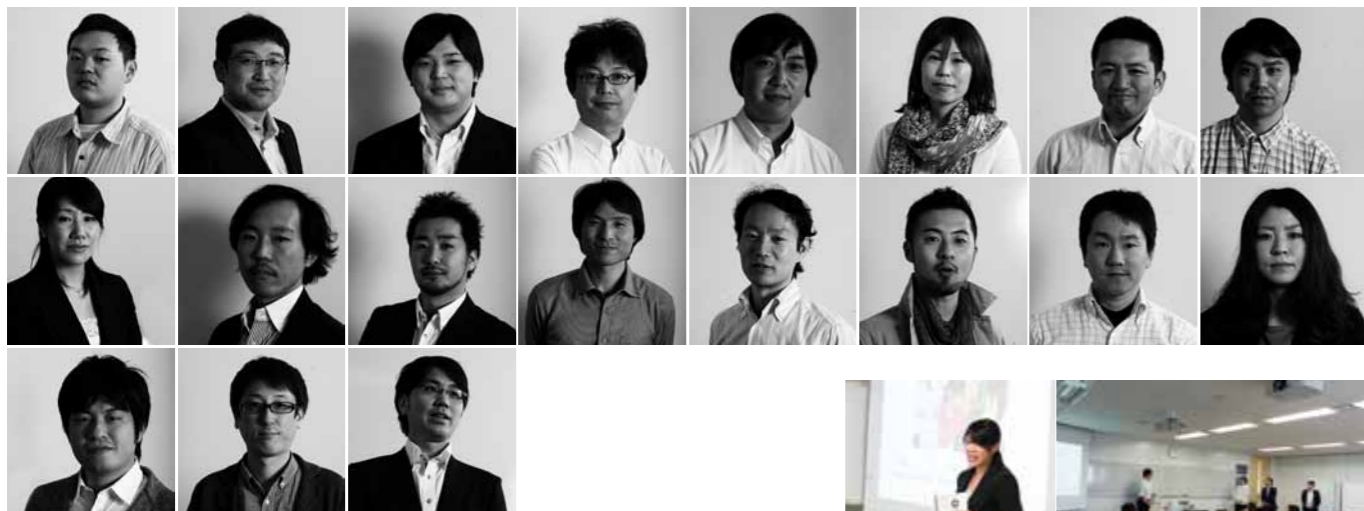
今回の基金で奨学生となった次世代を担うリーダーたち

ダイムラー社より提供された寄付金を、日本財団が、社会人向けMBAのグロービス経営大学院に委託。被災地の復興を担っていく若いリーダーたちの奨学金として活用した。