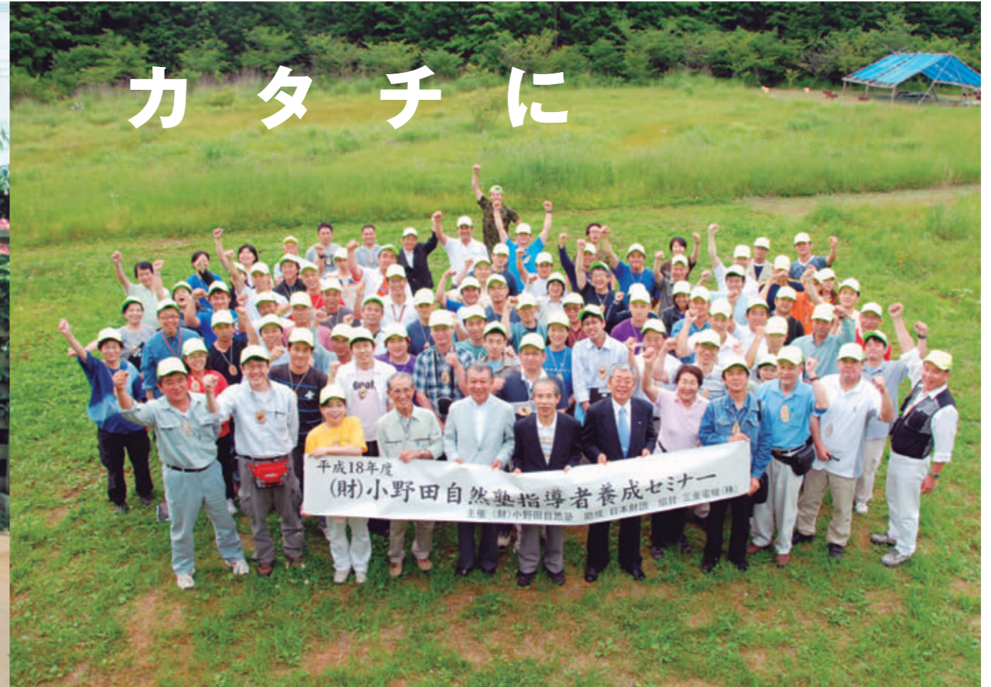
子どもたちに野外活動を通じた教育を実践する指導者支援セミナー[福島県東白川郡、2006年7月]