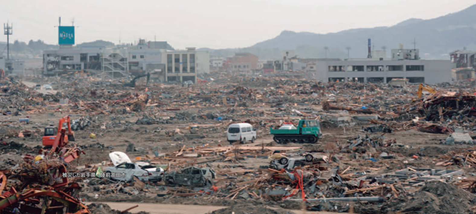
被災した岩手県・陸前高田市