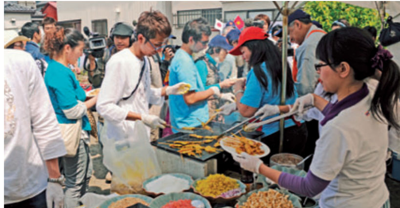
日本財団の協力のもと、ASEAN10か国の若者ら72人が避難所を訪れ、炊き出しなどを行った [宮城県石巻市、2011年6月]

民間ならではの柔軟性と助成事業で培った専門性を生かし、日本財団は世界中の人々から託された想いととも、被災地支援を展開してきました。今後もさまざまな主体とのパートナーシップを一層深めつつ、民が民を支える新たな社会づくりを行っていきます。