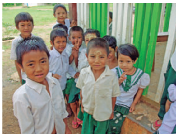
新設された校舎前で笑顔の子どもたち【ミャンマー】