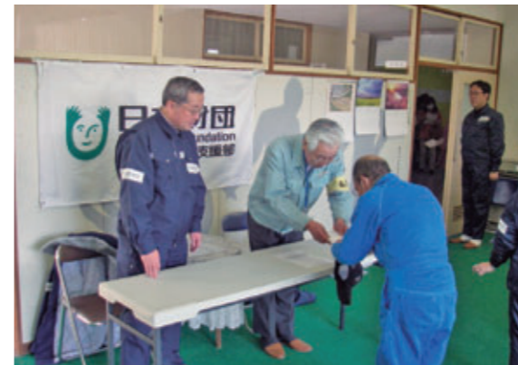
震災後、迅速に実施した弔慰金・見舞金の配布[宮城県女川町、2011年4月]