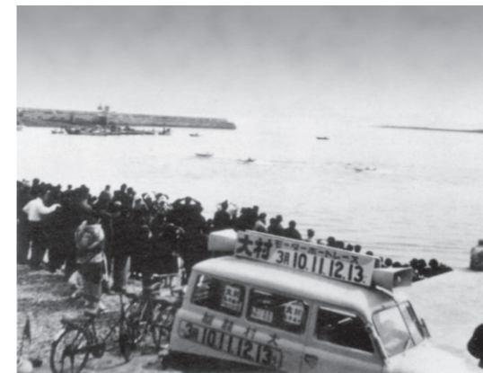
ボートレース試走会[長崎県島原外港、1954年3月]