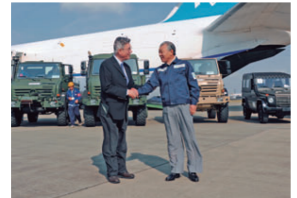
ダイムラー社による特殊車両の寄贈。世界最大のロシア製航空輸送機「アントフ」によって成田空港に届けられた[成田国際空港、2011年4月]