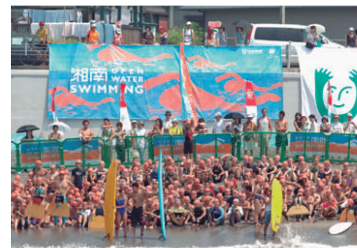
第2回オープンウォータースイミング大会【神奈川県藤沢市、2005年8月】