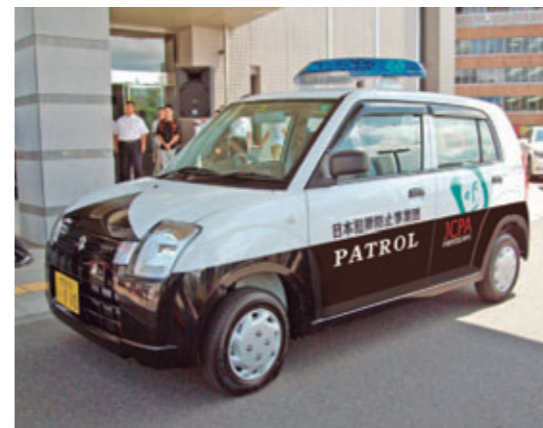
子どもたちの登下校時を中心とした、地域住民による自主パトロール活動を支援する青ハトを配備[鹿児島県鹿児島市、2008年7月]