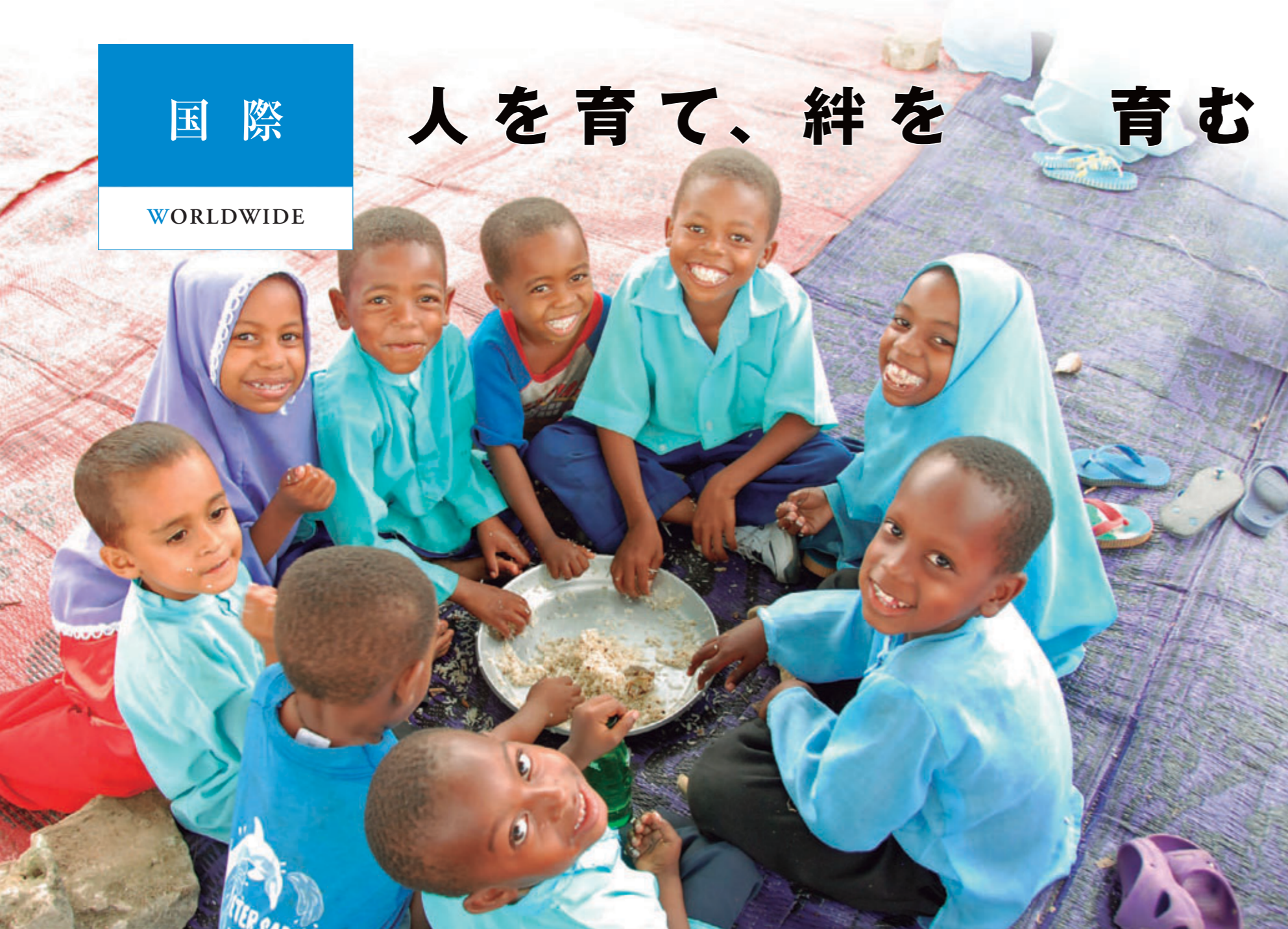
ハンセン病回復者が住む村の子どもたち【タンザニア・ベンバ島】