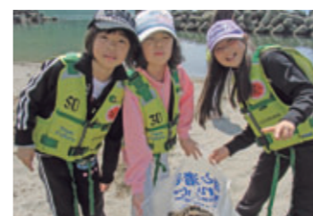
海洋体験教室で 海岸のゴミ拾いをする 子どもたち 【北海道神恵内村、 2009年6月】