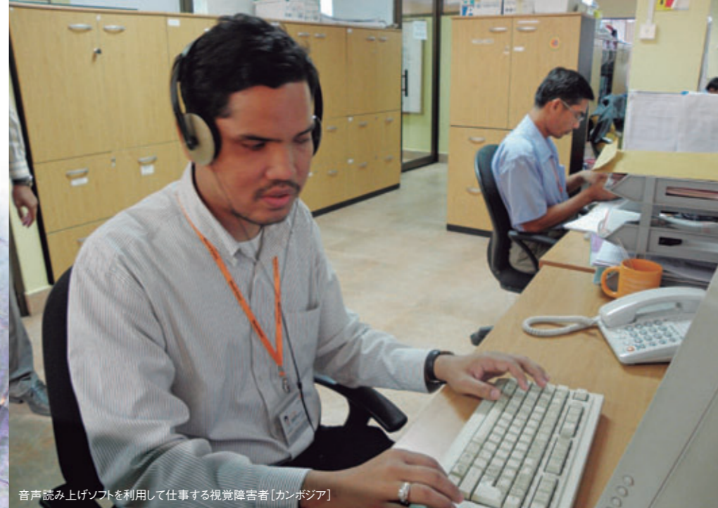
音声読み上げソフトを利用して仕事する視覚障害者【カンボジア】