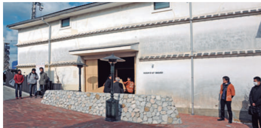
障害者によるアート・ブリュット作品を展示する「薬工ミュージアム」がオープン[高知県高知市、2011年12月]