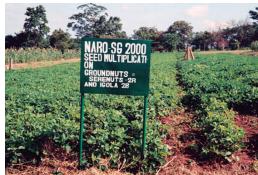
【SG2000】プロジェクトによって増産された落花生【ウガンダ】