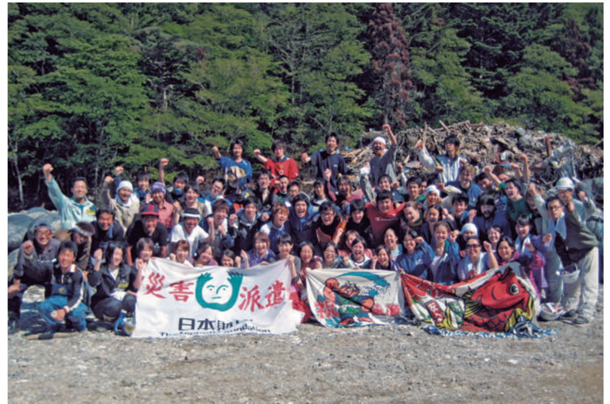
世界各国から多くの学生が参加した学生ボランティア隊