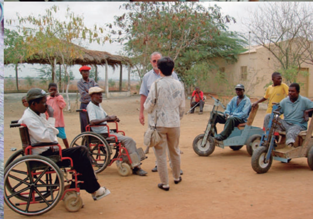
ハンセン病患者が住むコロニー【アンゴラ、2003年7月】

国際機関、各国政府、NGOなどと協力し、人々が直面する貧困、飢餓、病気などの基本的諸課題の解決や社会発展を担う人材の育成と、ネットワーク構築を目指した活動を展開しています。