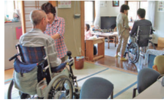
在宅療養を支えるデイホスピス

国内において、障害者の地域生活支援、福祉車両の配備、ホスピス・プログラム、子どもの健全育成、環境保全、災害援助、芸術文化や生涯スポーツの推進、犯罪被害者支援など、地域に密着した活動を支援しています。