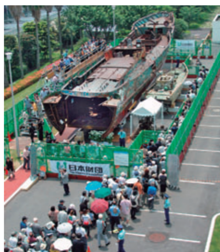
北朝鮮工作船の展示。 9か月間で162万人の国民が見学 【東京お台場・船の科学館、2003年5月】

日本が海洋国家であることを踏まえ、船舶・海洋に関する研究開発、航行安全・海洋環境保全などにかかわる諸問題に取り組み、海洋教育の普及や促進、海にかかわる人材育成などの支援を行っています。また、造船産業の振興を目的として、造船業者に資金の貸付を行っています。