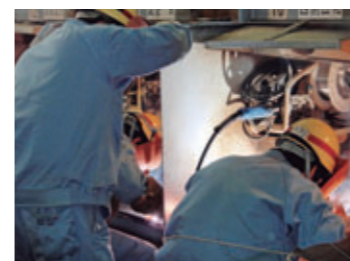
相生技能センターでの 溶接技能研修 【兵庫県相生市、 2010年5月】