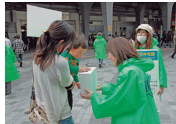
日本各地で東日本大震災街頭募金を実施