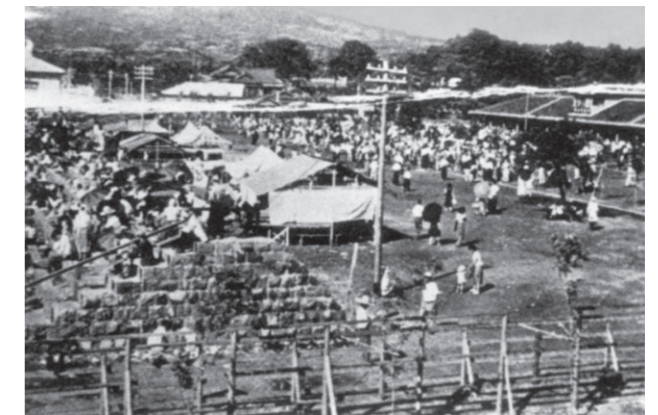
開催当初のスタンド[長崎県大村ボートレース場、1954年ごろ]