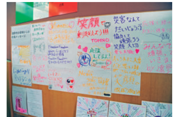
被災地に寄せられた多くのメッセージ[岩手県釜石市、2011年4月]