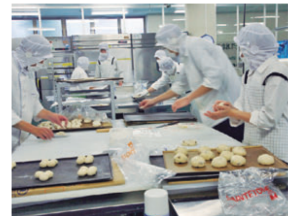
誰もが地域で豊かに暮らせる社会を目指し、障害者の生活を支援[福井県、2011年10月]