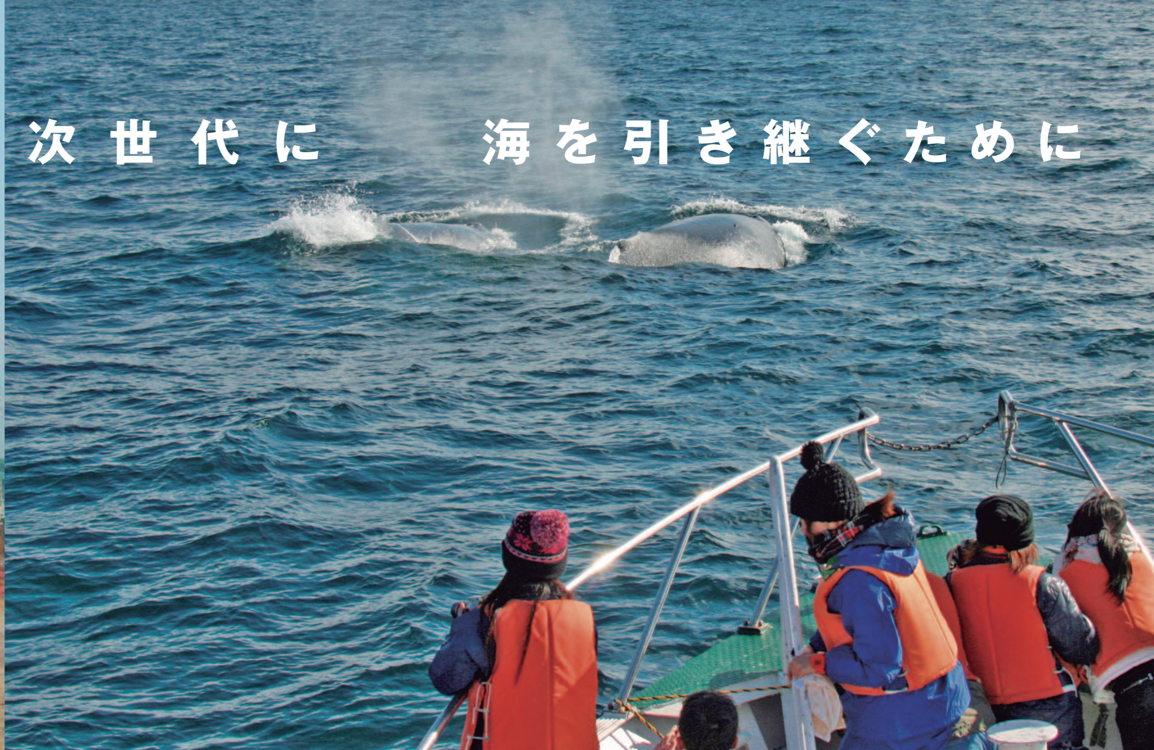
航海実習の一環として、ザトウクジラの親子を観察する学生たち 【北海道釧路沖、2007年7月】

日本が海洋国家であることを踏まえ、船舶・海洋に関する研究開発、航行安全・海洋環境保全などにかかわる諸問題に取り組み、海洋教育の普及や促進、海にかかわる人材育成などの支援を行っています。また、造船産業の振興を目的として、造船業者に資金の貸付を行っています。