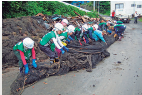
被災地で活動する学生ボランティア[宮城県田代島、2011年7月]