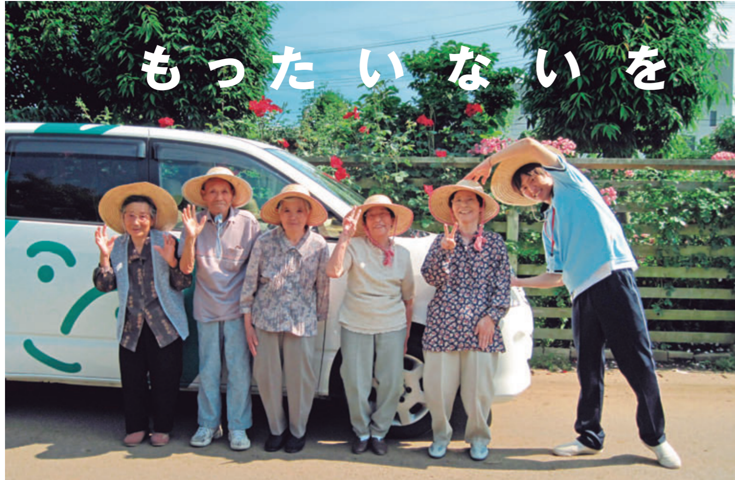
日本財団が配備した福祉車両と利用者の皆さん