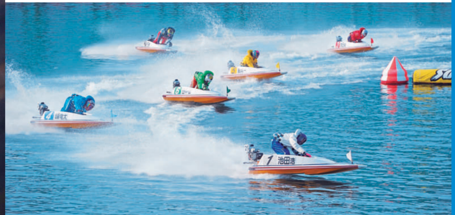
SG第14回チャレンジカップ[長崎県大村ボートレース場、2011年11月]