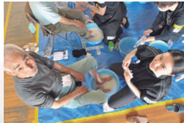
被災者の心と体をほぐす足湯ボランティア[宮城県石巻市、2011年6月]