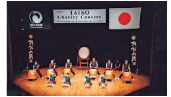
太鼓チャリティーコンサート[東京・草月ホール、2003年5月]