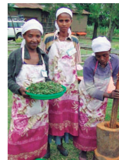
【SG2000】プロジェクトの一環で衛生的で均質な商品づくりの指導を受ける女性たち【エチオピア】