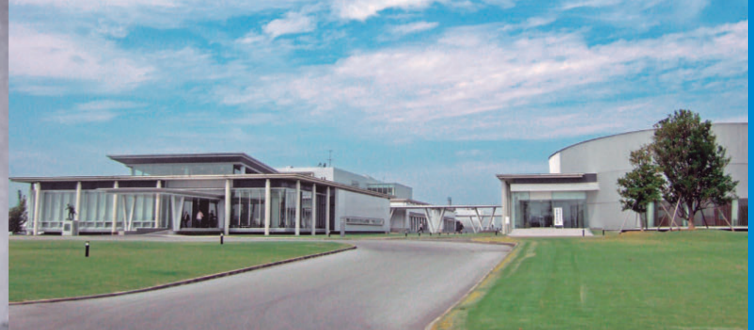
やまと学校[福岡県柳川市、2009年9月]

地方自治体が主催するボートレース事業からの拠出金をもとに、日本財団は活動しています。拠出金は、ボートレースの売上金の約2.5%に当たるもので、その配分は「モーターボート競走法（1951年制定）」の定めに従い、厳正に行われています。