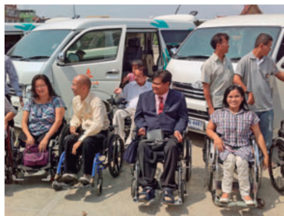
身体障害者に日本財団の福祉車両を寄贈【タイ】

国際機関、各国政府、NGOなどと協力し、人々が直面する貧困、飢餓、病気などの基本的諸課題の解決や社会発展を担う人材の育成と、ネットワーク構築を目指した活動を展開しています。